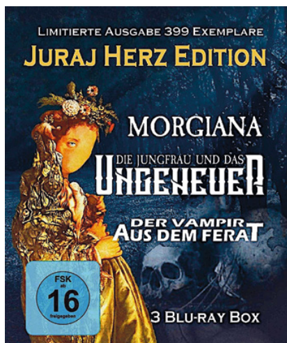
DVD-Box mit drei Juraj Herz-Horrorfilmen

Trotzdem ebnete dieser Kurzfilm Juraj Herz den Weg zu seinem ersten Spielfilm „Znamení raka“ (Sign of the Cancer). Dieses 1967 gedrehte psychologische Drama über das Leben in einem Krankenhaus machte ihn sofort zu einem Ziel der Zensur und Kritik. Nachdem jedoch ein renommierter Arzt bestätigt hatte, dass alles, was Herz über den medizinischen Bereich darstellte, weitgehend auf Wahrheit beruhte, wurde er als Regisseur akzeptiert.