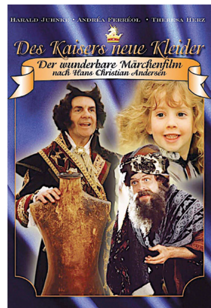
Georg Herz führte Regie im Märchenfilm „Des Kaisers neue Kleider“ u.a. mit Harald Juhnke