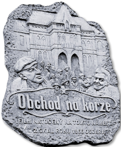
Die Tafel in Sabinov erinnert an den Drehort des Oscar-prämierten Films „Obchod na korze“

Im Jahr 1965 gab er sein Debüt als Regisseur mit dem Kurzfilm „Die gesammelten Rohheiten“ (Sběrné surovosti) des bekannten Schriftstellers Bohumil Hrabal (1914-1997). Der Film gab Erlebnisse von Hrabal, der einmal in einer Altstoff-Sammelstelle gearbeitet hatte, wieder. Das Drehbuch hatte Herz gemeinsam mit Hrabal geschrieben. Der Streifen kam nicht in das normale Filmprogramm, weil sich seine Länge (31 min) angeblich nicht für Aufführungen eignete. Herz sah das anders und meinte, man sehe ihn nicht als gleichwertig an, sondern „nur als einen Puppenspieler, der einen Film macht.“