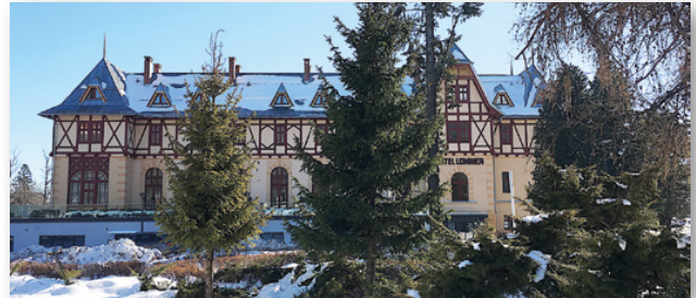
Das Hotel Lomnica